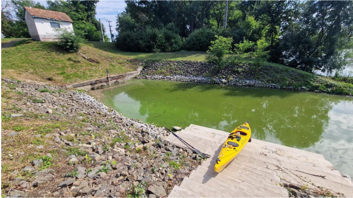
Bartal csatorna - Tolnai víz oldal (12:03)