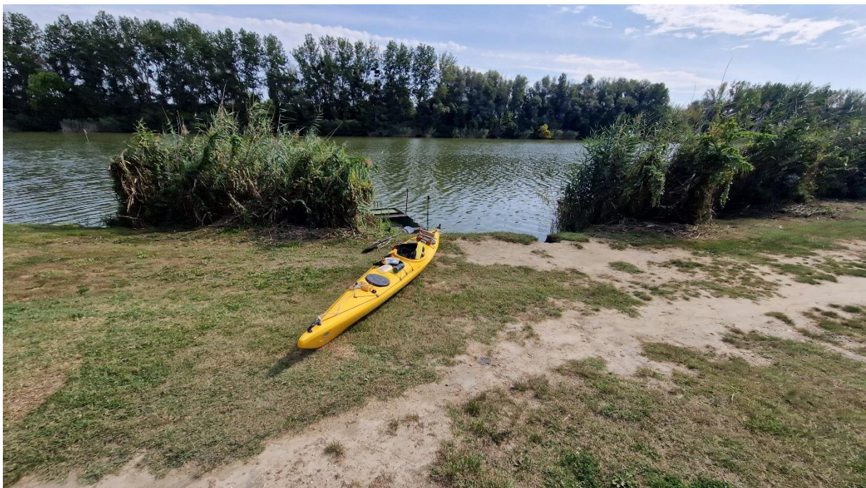
Érkezés Tolnára a Stern telephez (Fürdőház utca) (12:56)