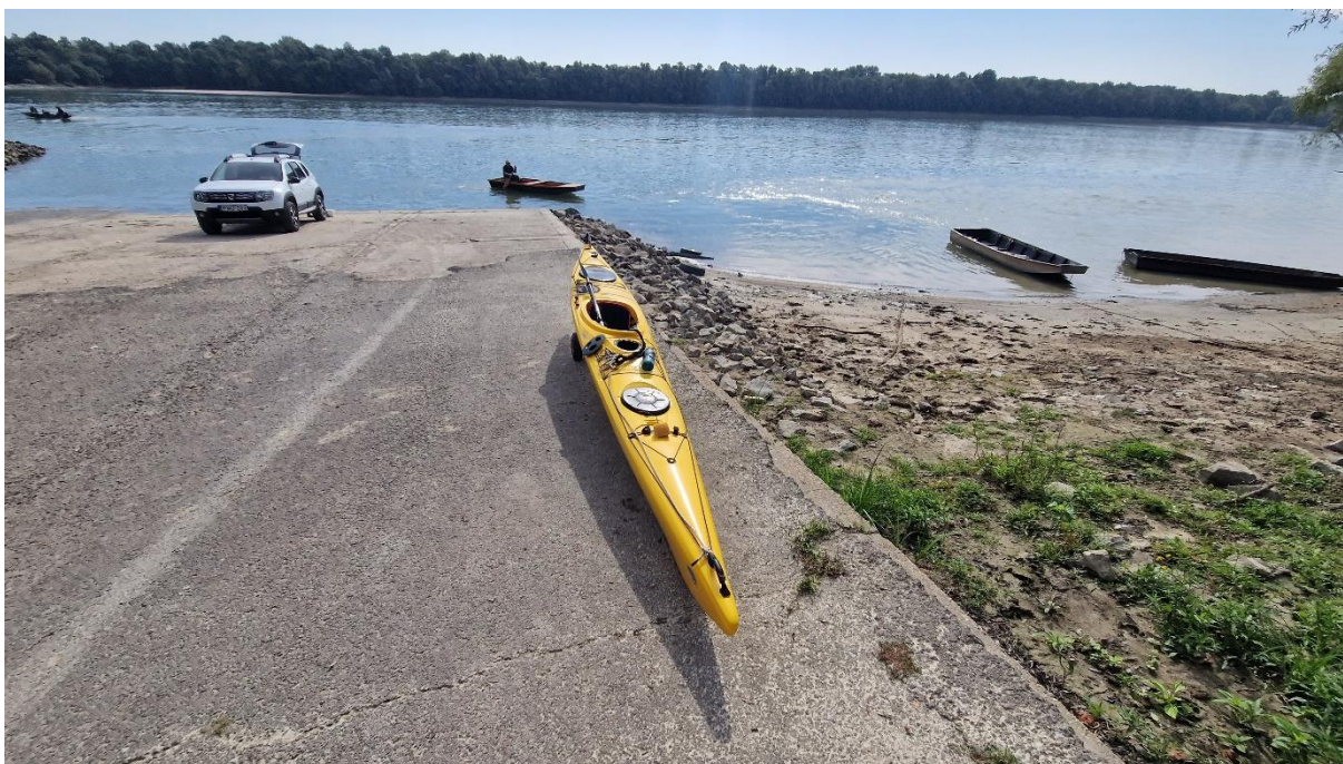
Dombori Duna 1507,2 fkm - csónakleeresztő (10:48)