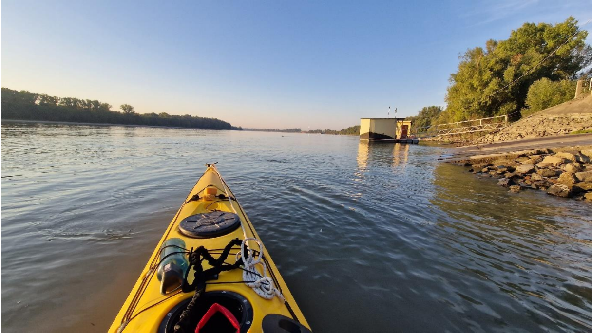
Indulás: Paks 1530,5 fkm – csónakleeresztő (7:27)